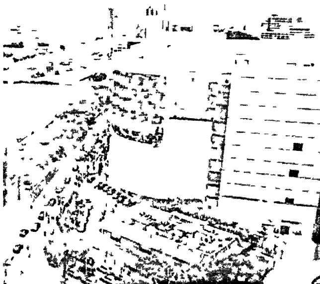
Vista do Shopping Bourbon em SP

MARIO CESAR CARVALHO DA REPORTAGEM LOCAL